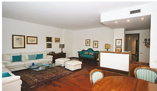
Classe "F", EPgl,nren 188,82 kWh/mq anno