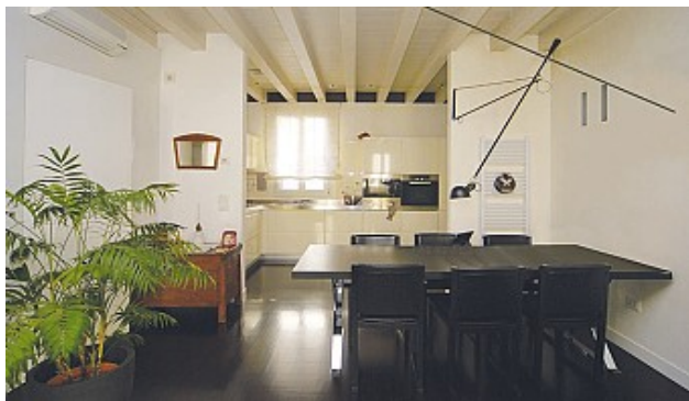
Classe "D", EPgl,nren 121,69 kWh/mq anno EPgl,ren 7,55 kWh/mq anno