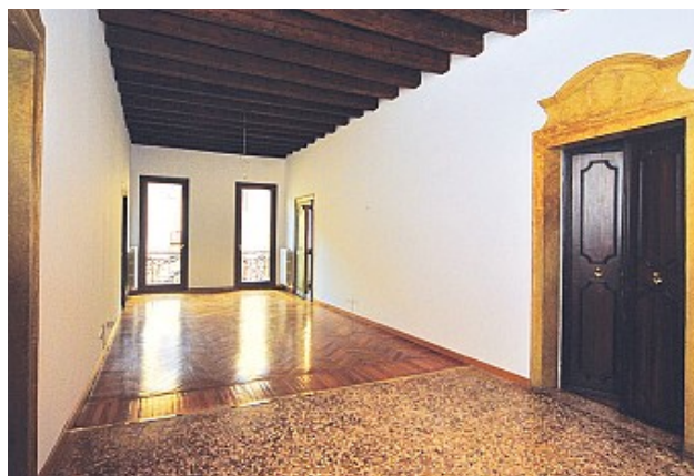
Classe energetica in fase di definizione